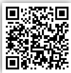
Gambar 1. Barcode Bahan Ajar

Kedua, cara untuk mengakses bahan ajar ini juga didesain dengan sangat mudah dan praktis, yakni cukup dengan mengunjungi link yang telah tersedia, yaitu https://heyzine.com/flip-book/ad3edfabdd.html atau dengan memindai kode QR berikut.