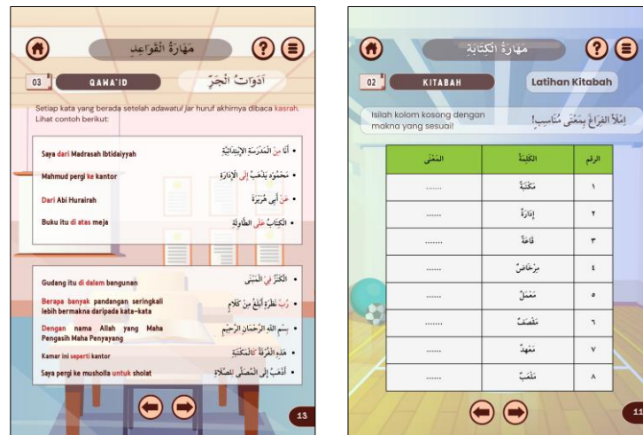
Gambar 4. Tampilan Materi Qawaid dan Kitabah

Untuk meningkatkan keterlibatan belajar, ditambahkan fitur-fitur interaktif seperti mendengarkan suara melalui gambar, dan latihan berbasis permainan. Sebagai alat ukur pemahaman, peneliti juga mengembangkan evaluasi formatif berupa kuis yang bisa diakses secara online. Desain pembelajaran disusun untuk mencapai tujuan yang telah ditetapkan, yaitu meningkatkan keterampilan menulis ( maharah kitabah ) dan pemahaman tata bahasa ( qawā'id ) siswa. Setiap elemen dalam materi ajar, mulai dari struktur konten hingga elemen interaktif, dirancang untuk mendukung pencapaian tujuan tersebut. Hal ini memastikan bahwa materi ajar tidak hanya informatif tetapi juga efektif dalam meningkatkan kompetensi siswa.