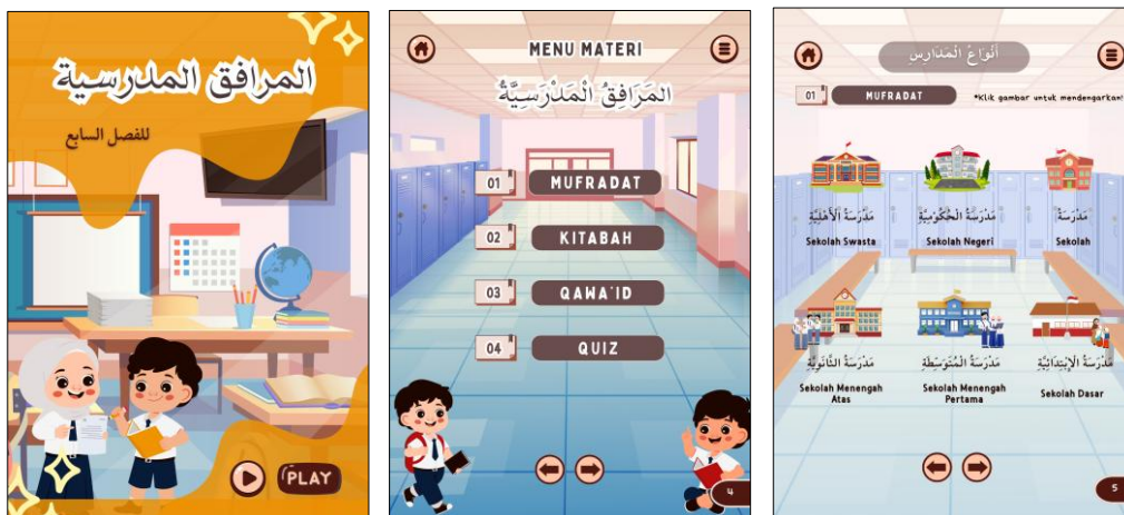
Gambar 3. Tampilan Bahan Ajar berbasis Flipbook

Ketiga, rancangan media pembelajaran mengedepankan prinsip kemudahan penggunaan dan berfokus pada kebutuhan siswa. Hal ini tampak dari navigasi yang sederhana, visual yang menarik dengan kombinasi warna yang ramah anak (warna yang terang), serta penggunaan suara dari penutur asli untuk meningkatkan pemahaman bahasa. Desain tombol dan ikon dibuat intuitif agar mudah dikenali dan digunakan oleh siswa.