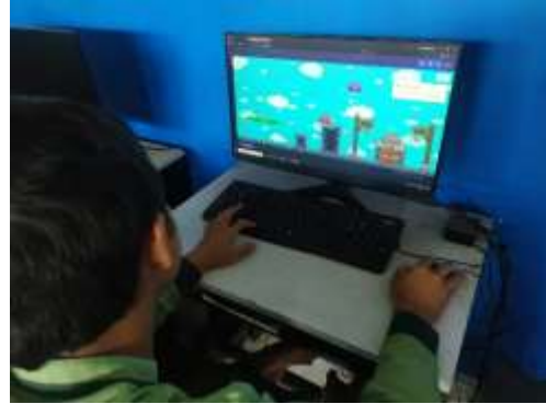
الصورة ١ .