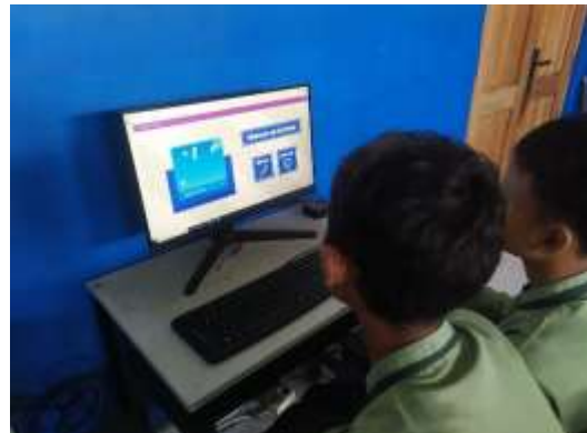
الصورة ٢ .