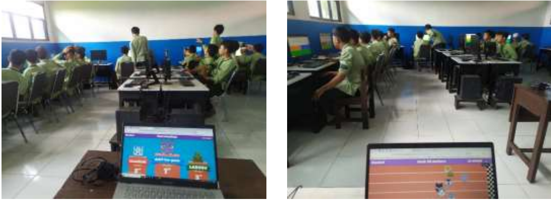
الصورة ٣ .

وأما خطواتها فهي أن يستعد الطلبة في الصفحة الأولى لتلك البرمجة. وبالتالي أعلن المدرس الأرقام السرية الخاصة للدخول إلى اللعبة. وبعد كتابة الأرقام وجب على جميع الطلبة أن يكتبوا أسماءهم ثم بدأوا يتسابقون فيما بينهم من خلال الإتيان بالأجوبة الصحيحة (Firli, Camellia, & Maimun, 2022). وهذا إن دلى على شيء فإنا يدل على أن هذه البرمجة لها مرونة للمدرس وسهل الاستعمال. بهذه الاعتبارات استخدم المدرس هذه البرمجة لهذا النشاط. وذلك لأن هذه البرمجة لها من الألعاب المتنوعة أكثر من البرمجة السابقة غير أنها يجب على من أدارها أن يستخدم الحاسوب. وأما برمجة Gimkit فيكفي من أدارها أن يديرها من خلال الهاتف الذكي مع قلة أنواع الألعاب الافتراضية. والحاصل أن هاتين البرمجتين تقدمان فرصة التسابق بين الطلبة بالإضافة إلى الخبرة الجديدة في التعليم.