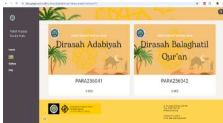
الصورة ١. حزمة الأدب العربي الخاصة

في العرض الأولي (الصفحة الرئيسية) لوسيلة التعلم القائمة على مواقع جوجل، توجد ثلاث صفحات رئيسية، وهي نظام إدارة التعلم (LMS) والمعرض والأسئلة الشائعة. تحتوي صفحة نظام إدارة التعلم على حزمة تعليمية خاصة تشمل مواد الأدب العربي وبلاغة القرآن بشكل منظم وفقاً لمخرجات التعلم المحددة. بعد ذلك، تعرض صفحة المعرض جدول أنشطة التعلم وتوثيق أنشطة الطلبة. في الوقت نفسه، توفر صفحة الأسئلة الشائعة مساحة تفاعلية للطلبة لتقديم الردود أو كتابة التعليقات أو النقاش حول المواد المدروسة. يمكن الوصول إلى رابط الحزمة التعليمية الخاصة على الرابط التالي: