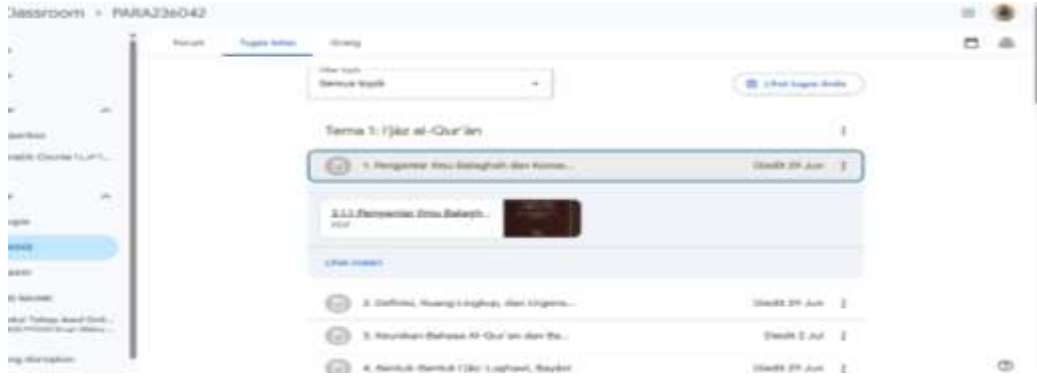
الصورة ٣. مقرر الأدب العربي

بناءً على العرض في الصورة ٥، في صف مقرر بلاغة القرآن، يمكن الوصول إلى كل موضوع أو لقاء تعليمي من خلال ملف عرض تقديمي (PPT) يحتوي على المادة الرئيسية والمراجع الداعمة وأمثلة من البلاغة في القرآن الكريم. رُببت جميع المحتويات بشكل منهجي لتسهيل فهم الطلبة لمفهوم وتطبيق بلاغة القرآن بشكل أعمق.